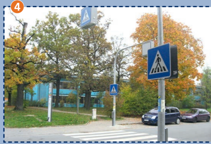
4 Cincinnatistraße, vor der Mittelschule;